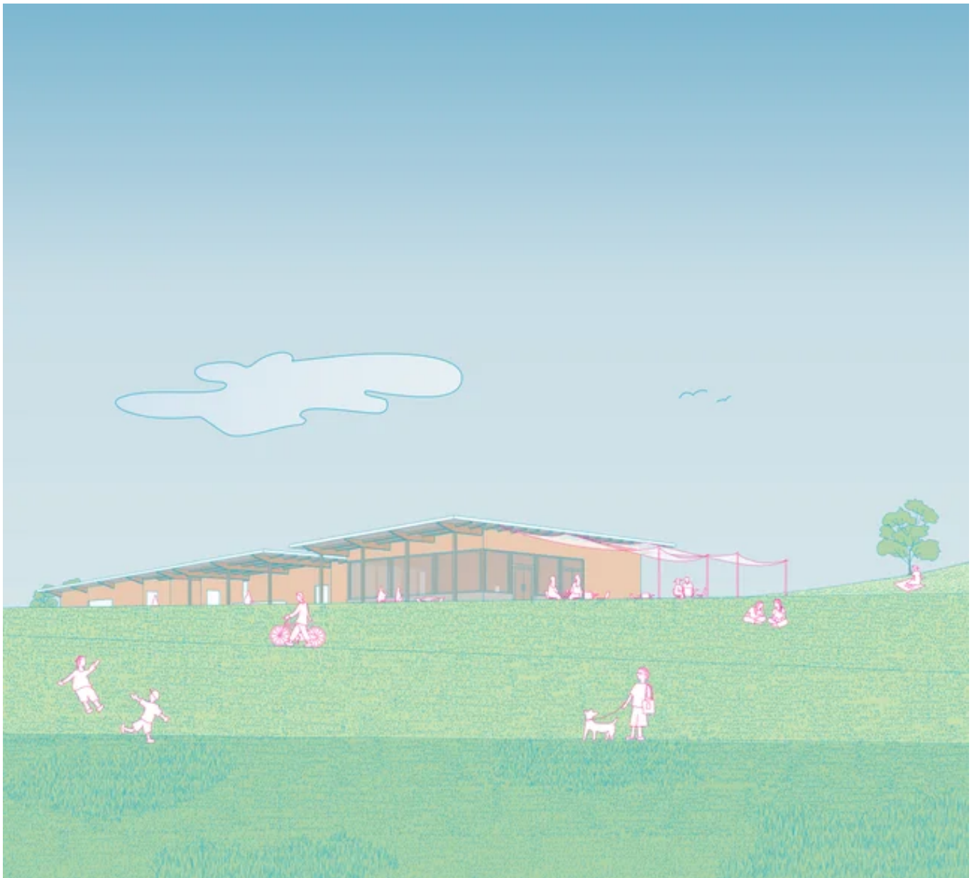
外観アイレベル図1