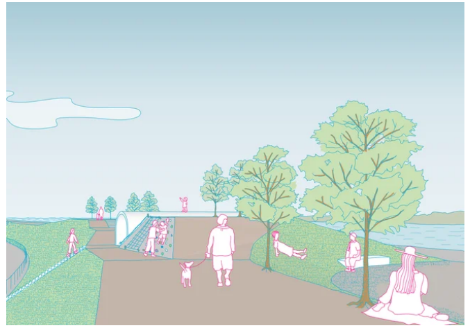
外観アイレベル図3

今後、株式会社クル、株式会社ムサシ、前川建設株式会社は、地域の特性を活かした施設計画を進め、加古川市に新たな賑わいを創出することを目指します。